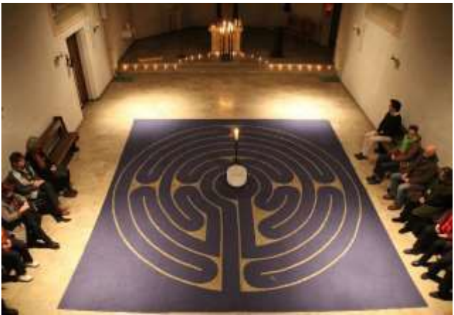
Das Labyrinth als Lebensweg zu Gott, mit Helge Burggrabe, Symposium 2016