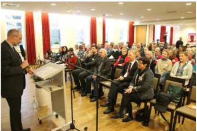
Beginn des 4. interdisziplinären Symposiums 2016 in Bocholt

und Filme in den Kinos ab Januar 2018 in Ahaus und Steinfurt